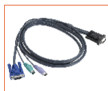
名称: 1.8 米 PS/2 信号线 型号: CH-1800P 接口类型: PS/2 线长: 1.8 米

CH-1802U 1.8 米 USB KVM 信号线, KVM (黄) /PC (蓝)