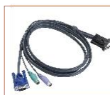
名称: 1.8 米 PS/2 信号线 型号: CH-1800P 接口类型: PS/2 线长: 1.8 米