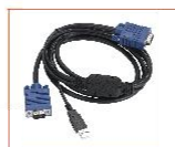
名称: 1.8 米 USB 信号线 型号: CH-1800U 接口类型: USB 线长: 1.8 米

CH-1800U 1.8 米 USB KVM 信号线, KVM (蓝) / PC (蓝)