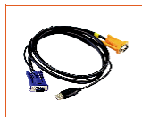
名称: 1.8 米 USB 信号线 型号: CH-1802U 接口类型: USB 线长: 1.8 米

CH-1802U 1.8 米 USB KVM 信号线, KVM (黄) /PC (蓝)