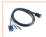
名称: 1.8 米 PS/2 信号线 型号: CH-1800P 接口类型: PS/2 线长: 1.8 米